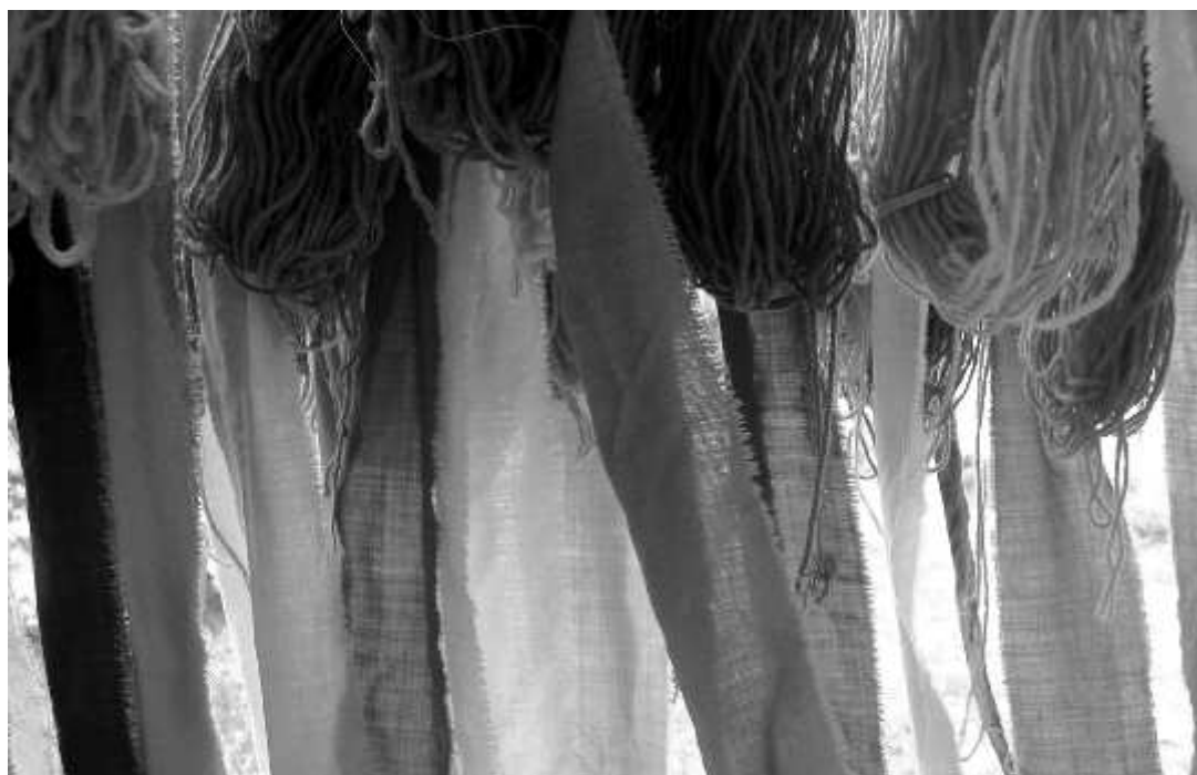
Campioni di tessuto tinti con le piante del Parco

La riappropriazione di queste conoscenze potrà consentire l'avvio di attività professionali e progetti sul territorio, connessi al patrimonio culturale locale e rivolti allo sviluppo dell'occupazione, in linea con l'idea di uno sviluppo ambientale ecosostenibile.